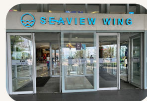
【SMシーサイドシティ】 乗車・降車場所 SEAVIEW WING