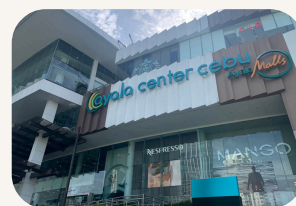
【アヤラセンターセブ】 乗車・降車場所 ルスタンス側エントランス