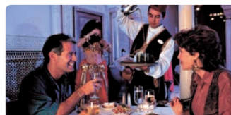
テーブルサービスレストラン (1泊につき1回分)

1日につき下記のお食事2回とスナック2回とおかわりし放題のリゾート・マグカップが付いています！