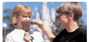
カートで販売されているスナック (1泊につき2回分)

ソフトドリンク、ポップコーン、アイスクリームなどのスナックからお選びいただけます。