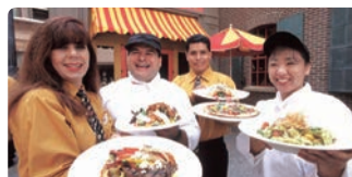
クイックサービスレストラン (1泊につき1回分)

メイン料理+デザート+ソフトドリンク、又はビュッフェ形式のお食事+ソフトドリンク ※テーブルサービスレストランのチップはお客様ご負担となります。