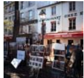
テートル広場イメージ