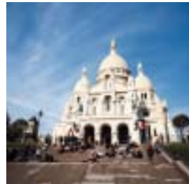
サクレクール寺院

10:30 頃 パリの北端にあるモンマルトルの丘に到着。丘の上には白く輝くビザンチン・スタイルの教会「サクレクール寺院」も、芸術家が集うテートル広場と見所盛り沢山です。(所要時間約 30 分)