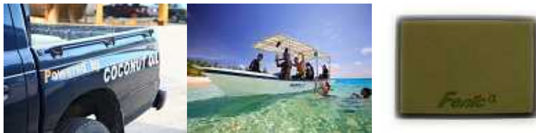
左中: 燃費改質器を使用した、車とボート 右: イオン・パワーシート

地球温暖化による影響からマーシャル諸島を守るために導入されたのが、フェニック社による「 イオン・パワーシート 」です。これは、ボートや車のエンジン(エアークリーナー)に、この特殊なシートを装着させることで、約 10～15%燃費を向上させ、さらに有害排気ガスを低減させるという効果があります。現在でもツアーで使用するボートや車にはこのシートが装着されています。