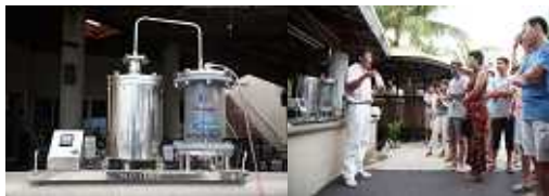
左: 油化装置 右: 観光客へ向けて油化装置の説明

また、ブレスト社提供の「 廃プラスチック油化装置 」は、不要なプラスチックを元のオイルへと戻すことでゴミを捻出せず、CO 2 削減に大きな役割を果たします。焼却処理施設のないマーシャル諸島の、深刻なゴミ問題解決のために導入されました。