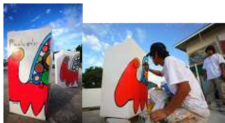
左: ごみ箱 右: ごみ箱作成風景