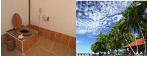
左:バイオトイレ 右:セレンディバ-アイランド

オガクズの交換は年に2~3回でメンテナンスも簡単。バイオ分解されたオガクズは土壌肥料として使用できます。