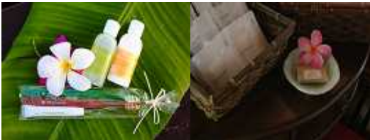
左:生分解性シャンプー & リンス、歯ブラシ 右:生分解性アメニティ

生分解性とは、シャンプー等の有機物が河川や海洋に流出した際、バクテリアによって分解され、水や二酸化炭素に分解される過程を数値で表した指標のことを指します。このエコシャンプーやリンスはマーシャル諸島の海や土壌への影響を低減します。